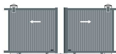
2 vantaux symétriques